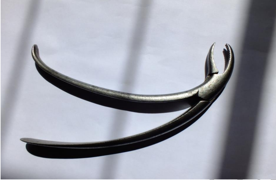
1900 lü yılların başlarında diş davyesi (H.Erkiletlioğlu Koleksiyonu)