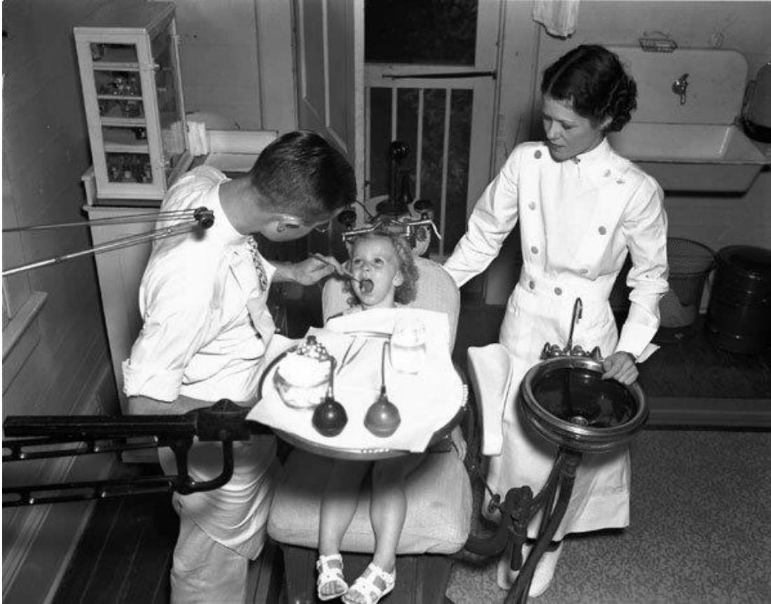
1936 tarihinde ABD de bir dişhekimliği muayenehanesi

Türkiye'de son senelerde artan üniversite sayısına paralel olarak çok sayıda dişhekimliği fakültesi açıldı. Böylece 2012 yılı itibariyle Türkiye'de 5,5 sene tedrisat yapan 47 ayrı Dişhekimliği Fakültesi mevcut hale geldi. Ancak bunların 13 ünün kanunları çıktığı halde henüz öğretime başlayamamışlardır.