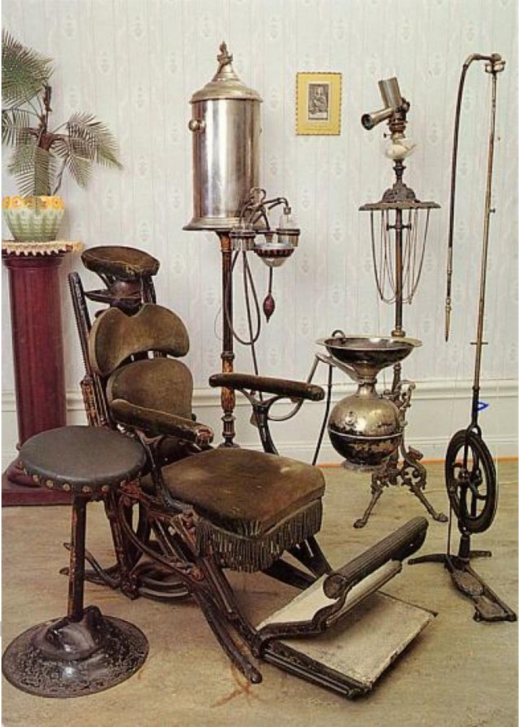
1. Yüzyılın Başlarında Bir Diş Muayenehanesi